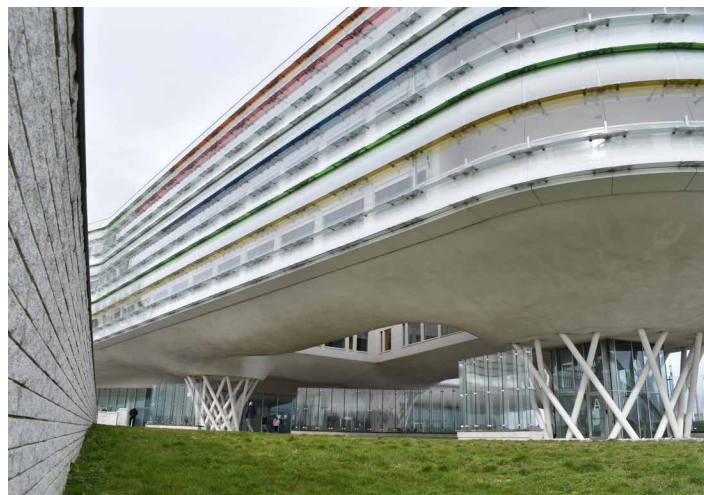
AZ Zeno investeerde in baanbrekende technologie voor het gebruik, de sturing en de opvolging van alle installaties.

AZ Zeno in Knokke-Heist heeft alles om de rol van 'ziekenhuis van de toekomst' te bekleden: een vooruitstrevende architectuur, state-of-the-art uitrustingen en veel 'slimme' technologie ter ondersteuning van personeel, patiënten en bezoekers. Zo garandeert een gebouwbeheersysteem een doorgedreven energiebeheer en een geoptimaliseerd comfort aan een minimale energiekost. Deze oplossing van Building-IQ is bovendien uitermate betrouwbaar omdat alle sturing gecentraliseerd verloopt via één virtuele controller in het datacenter.